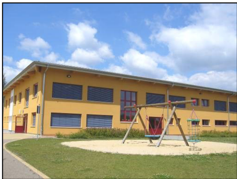
Serbska zakładna šula Raibicy