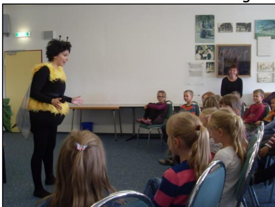
Die Kinder hörten ganz gespannt zu.