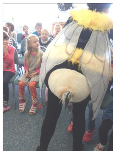
Hummel Hana's großer Stachel