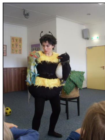
Hummel Hana mit ihren Freunden

Hummel Hana war unterwegs und kam auch in unsere Schule geflogen. Mit dabei waren ihre alten Freunde, der Drache Domabor und Pinguin Kurt. Hana erzählte den Kindern die Geschichte vom Riesen, der den Bauern während der großen Dürre half. Da staunten selbst ihre beiden Kumpel und schon waren sie beim Thema: Helfen. Warum ist es gut, jemandem zu helfen? Auch Hummel Hana wollte helfen und stellte am Ende sogar fest, dass es Spaß macht. Den Schülern der 1. und 2. Klassen hat der Auftritt von Hummel Hana sehr gefallen.