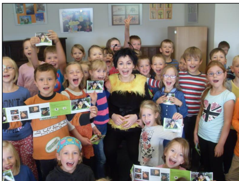
Schüler der 1. und 2. Klasse gemeinsam mit Hummel Hana