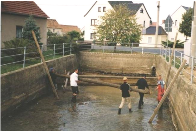
něhdyši wjesny hat - 2003