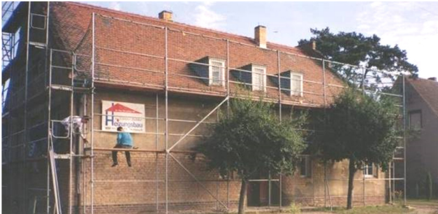
stara šula - 1996