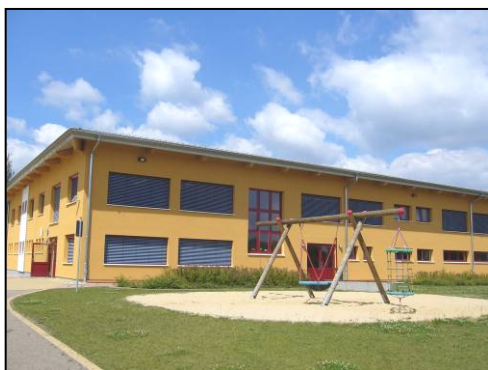
Serbska zakladna šula Rabicy