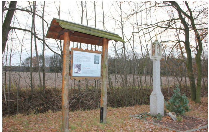
granitowy stołp „Mortwa holčka“ - 2016