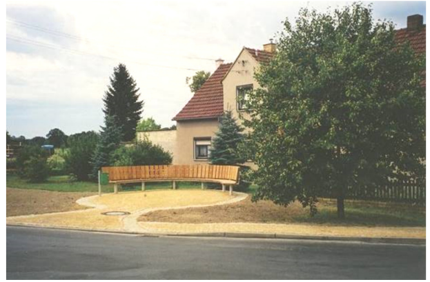
něhdyši wjesny hat - 2004