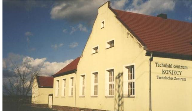
techniski centrum - 2002