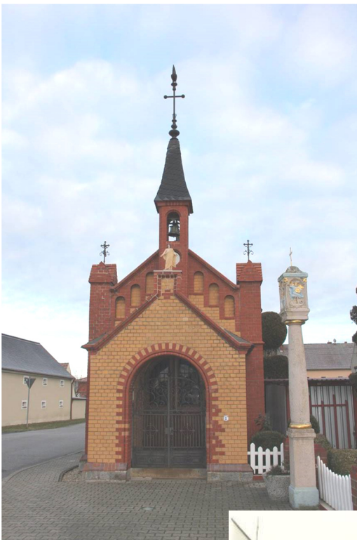
kapačka - 2016