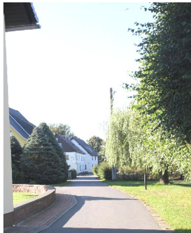
Fabrikska dróha, 2016