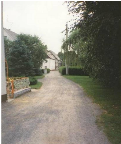
Fabrikska dróha, 1997