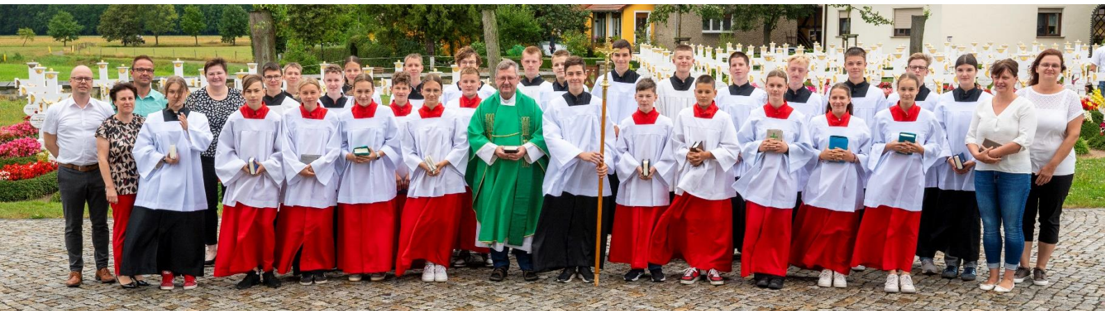
Zhromadny foto po wužohnowanju na Božej mši njedźelu, dnja 28. julija