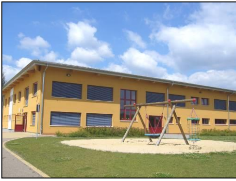
Serbská základna škola Ralbicy